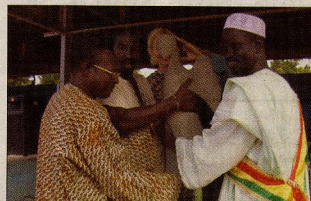
I staden Kita i Mali hjälpte borgmästaren (till höger) till när ängeln skulle placeras. Härnäst ska en ängel placeras på ett barnhem nära Khao Lak i Thailand.